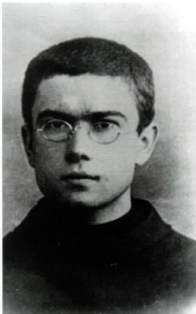
Fra Massimiliano giovane studente nell'Ordine dei Francescani Conventuali.

Nell'anno 1930 con altri quattro frati, parte per il Giappone, dove fonda «Mugenzai no Sono» o «Giardino